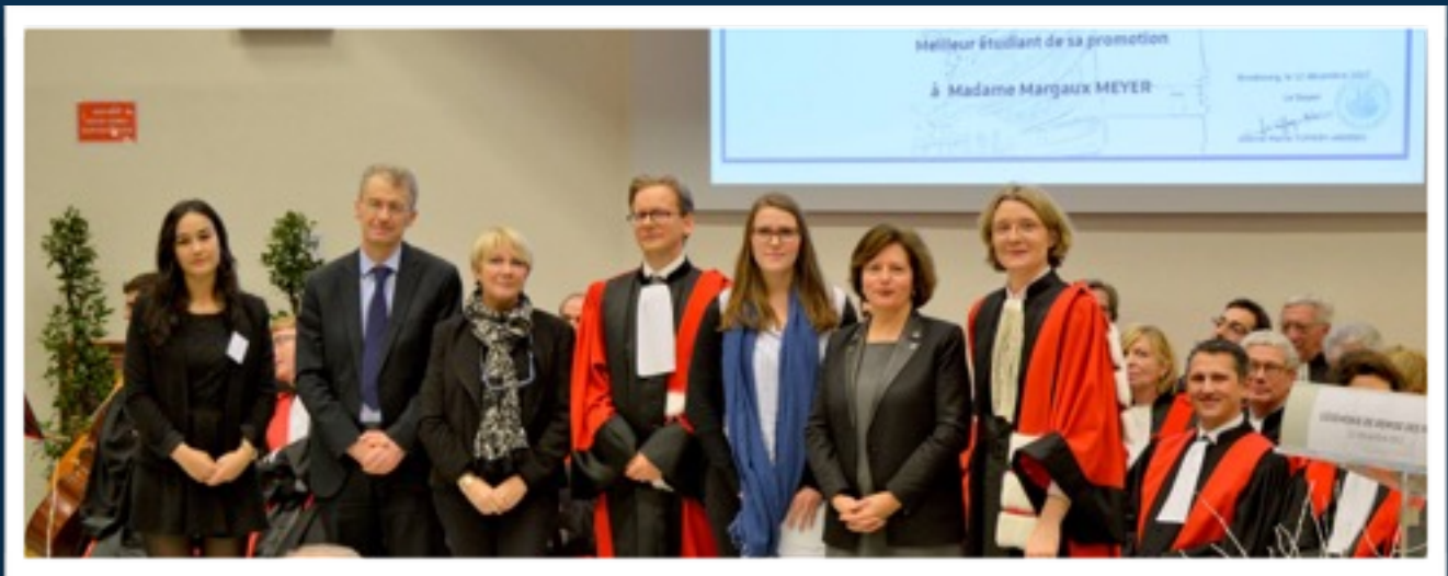
L'association Médiadroit remet chaque année, le prix du meilleur étudiant de Master 1 , lors de la Cérémonie de remise des prix de la Faculté de Droit, Sciences Politiques et Gestion de Strasbourg Cérémonie de remise des prix 2016/2017. Décembre 2017