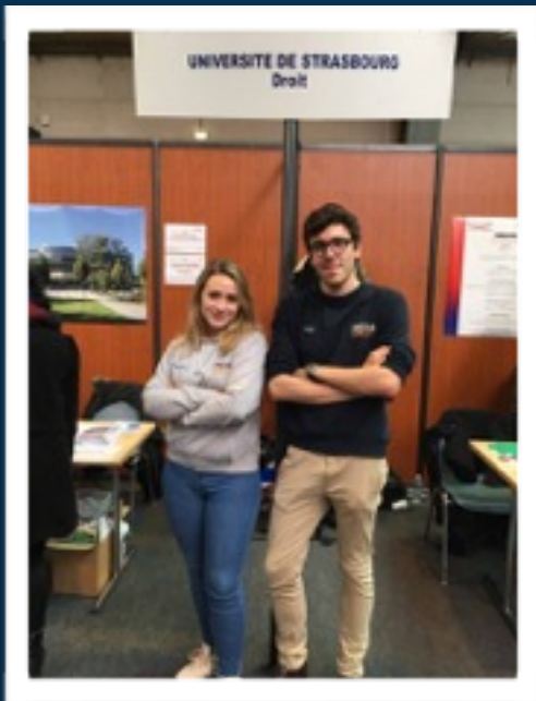
Les membres de l'association Médiadroit participent activement aux Journées Universitaires et aux Journées Portes ouvertes de l'Université de Strasbourg afin d'informer les futurs bacheliers sur les opportunités de carrières offertes par les études juridiques