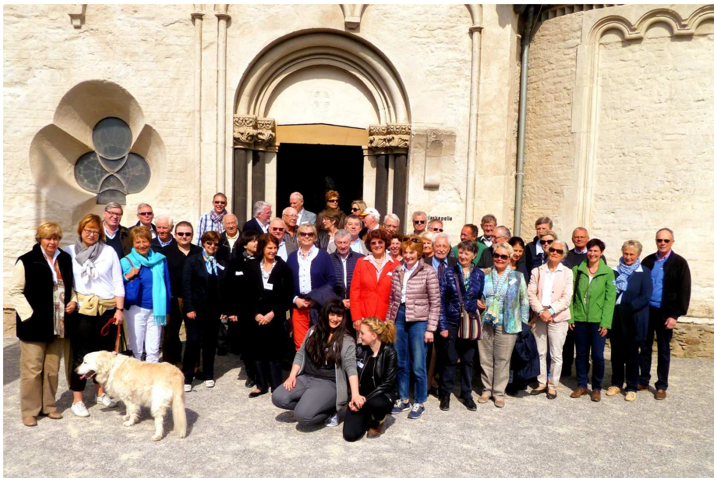
RC Neuwied-Andernach & RC Strasbourg-Est, une si belle amitié...