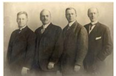
Les quatre premiers Rotariens : (en partant de la gauche) Gustavus Loehr, Silvester Schiele, Hiram Shorey et Paul P. Harris.

Dès sa création en 1905, le Rotary se cherche un emblème. La roue, symbole de mouvement et de civilisation est rapidement adoptée. Mais à partir de la simple roue de chariot choisie en 1905, l'emblème va connaître différentes évolutions. Le logo actuel est adopté en 1929 lors de la Convention de Dallas : 6 branches, 24 dents, une rainure de clavetage et l'incrustation de la marque Rotary International. C'est aujourd'hui la marque de fabrique des Rotary clubs du monde entier, de leurs actions et le signe de reconnaissance des Rotariens.